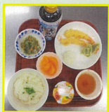
たなぼたメニュー